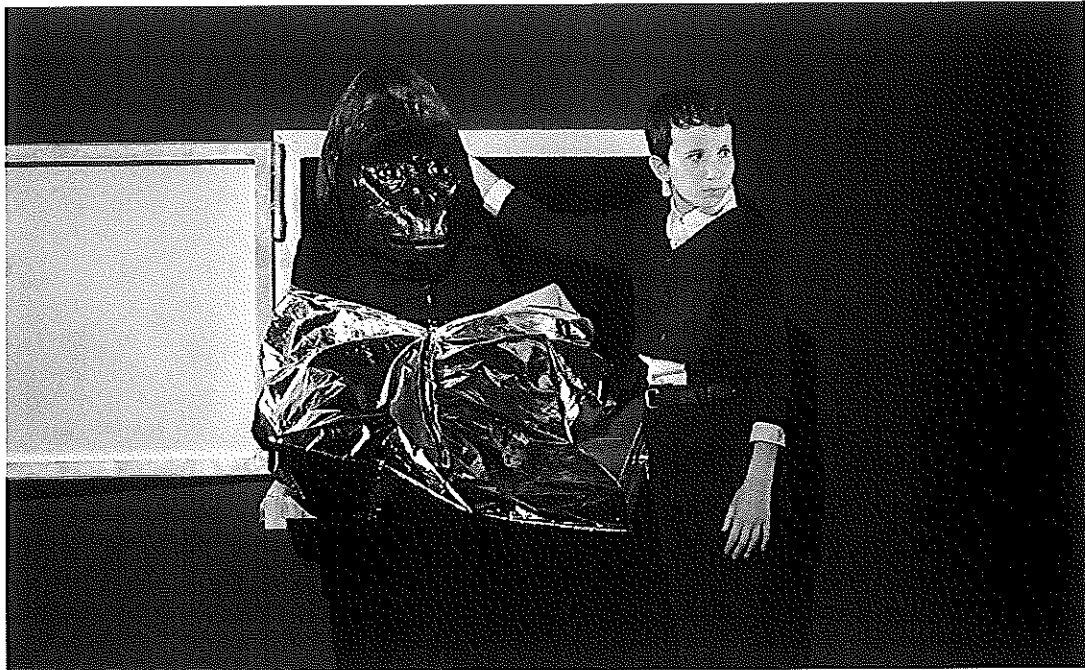
La morgue (detalle).