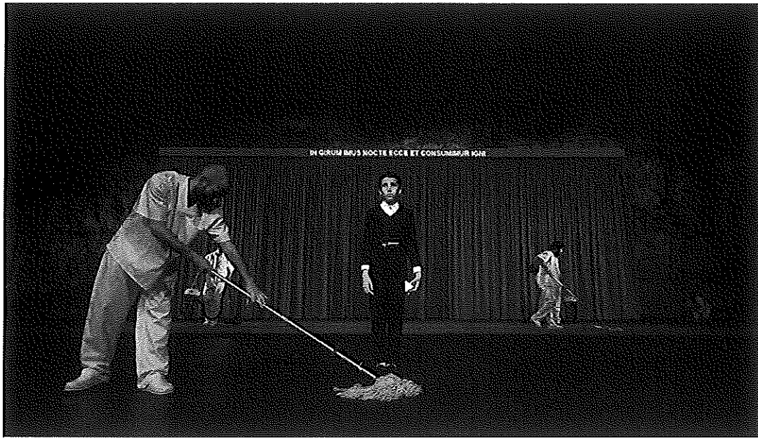
La escenografía completa al inicio del espectáculo.