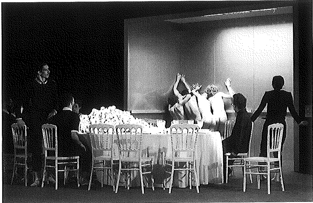
Detalle. El ascensor.